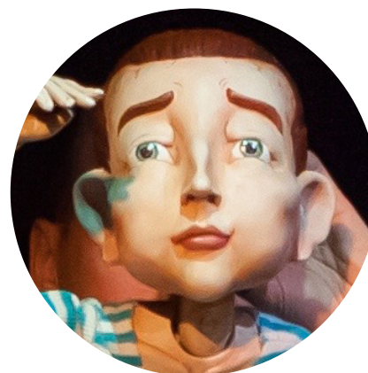
Personnage de Lou