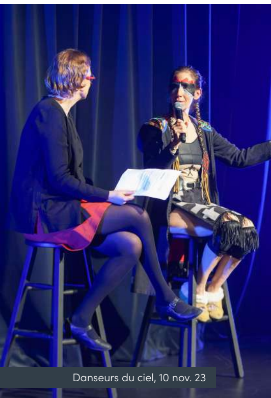
Danseurs du ciel, 10 nov. 23