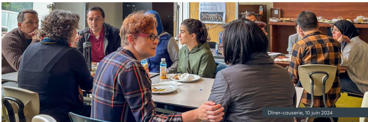
Dîner-causerie, 10 juin 2024

La Salle Pauline-Julien œuvre pour démocratiser l'accès aux arts vivants auprès de l'ensemble des citoyens de l'Ouest-de-l'Île et de l'est de Vaudreuil-Soulanges. La médiation culturelle constitue un outil précieux dans cette quête et est au cœur de notre mission.