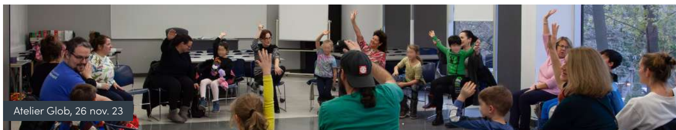
Atelier Glob, 26 nov. 23