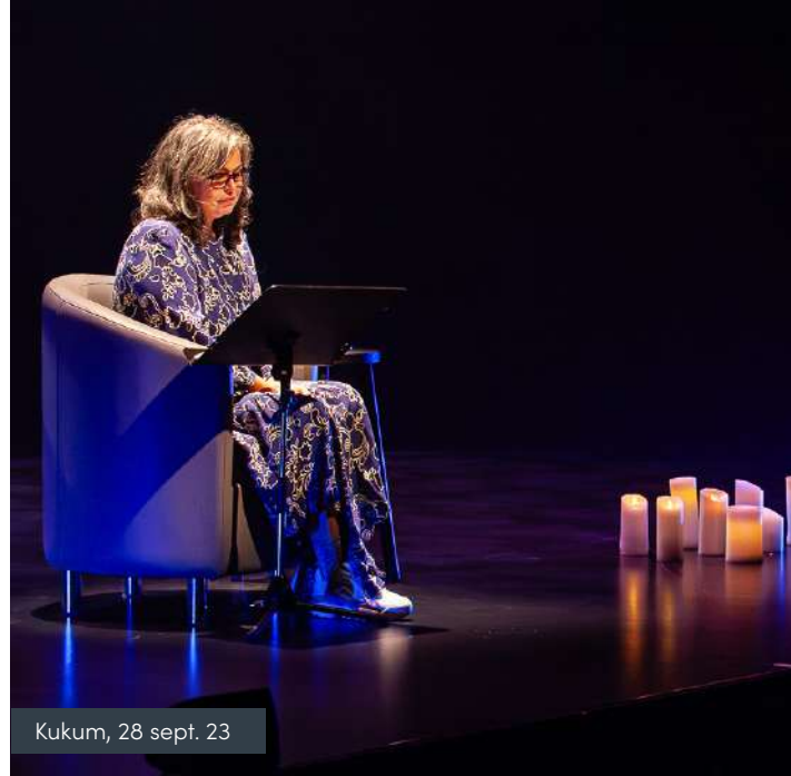
Kukum, 28 sept. 23