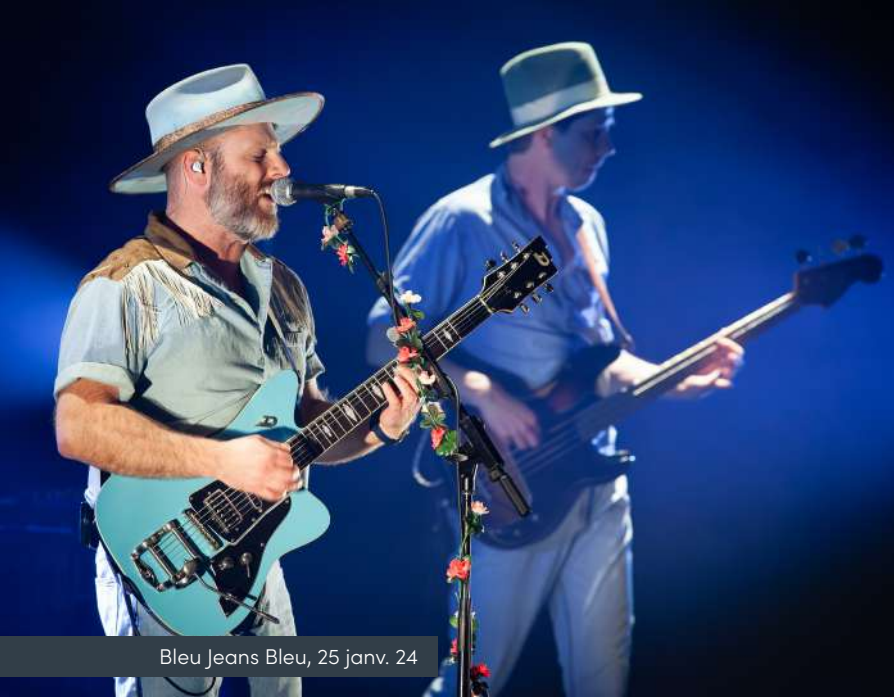
Bleu Jeans Bleu, 25 janv. 24