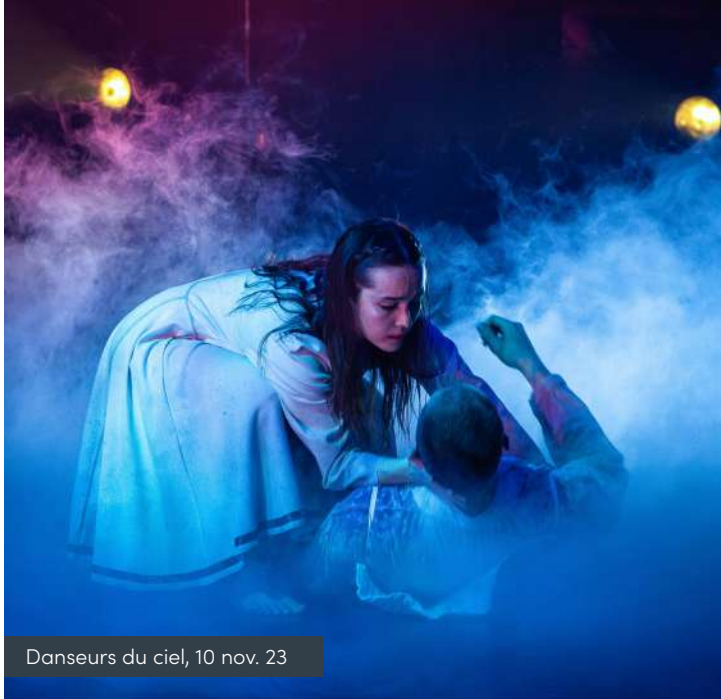
Danseurs du ciel, 10 nov. 23