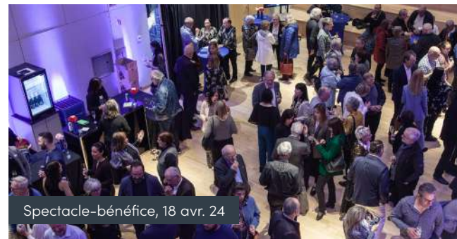
Spectacle-bénéfice, 18 avr. 24