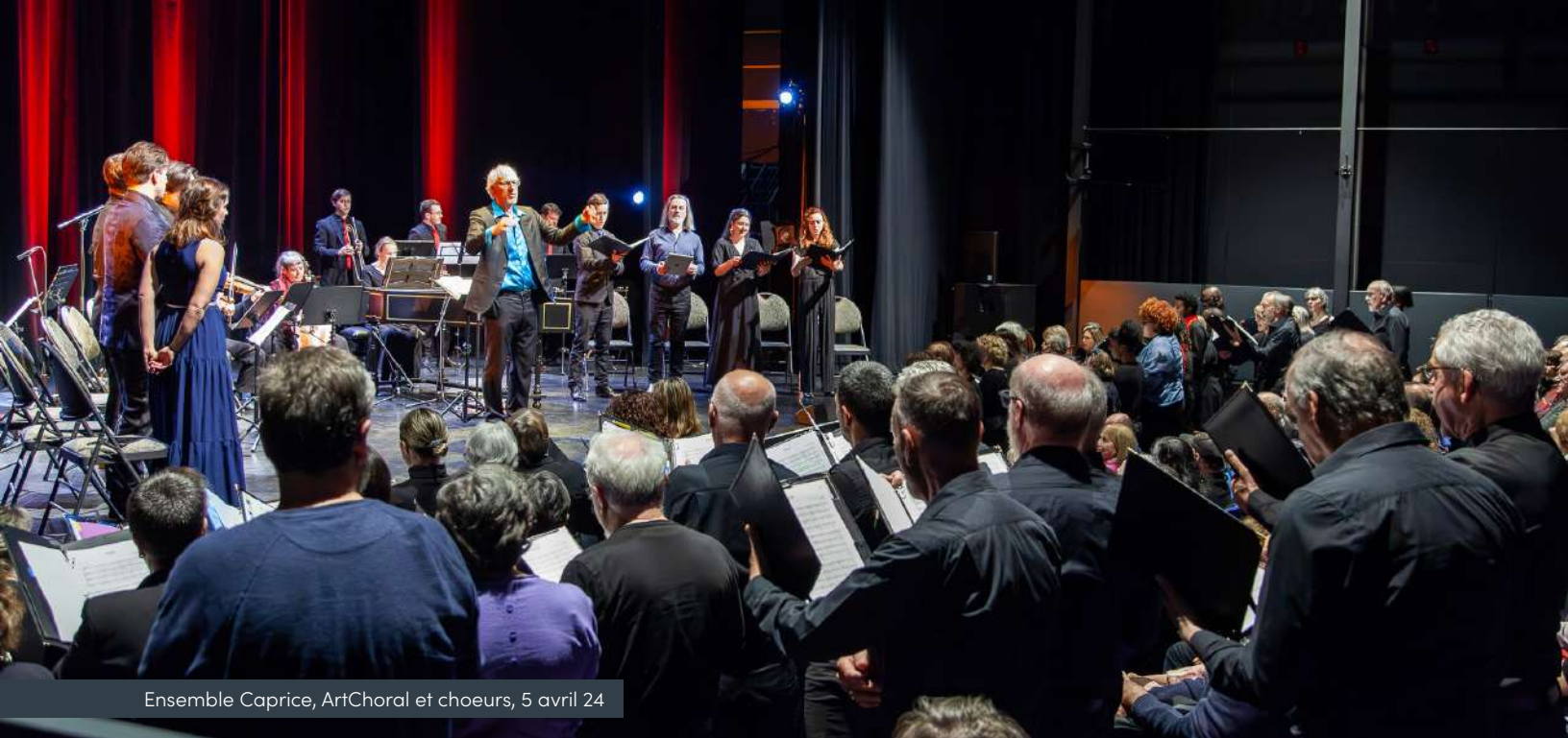
Ensemble Caprice, ArtChoral et chœurs, 5 avril 24