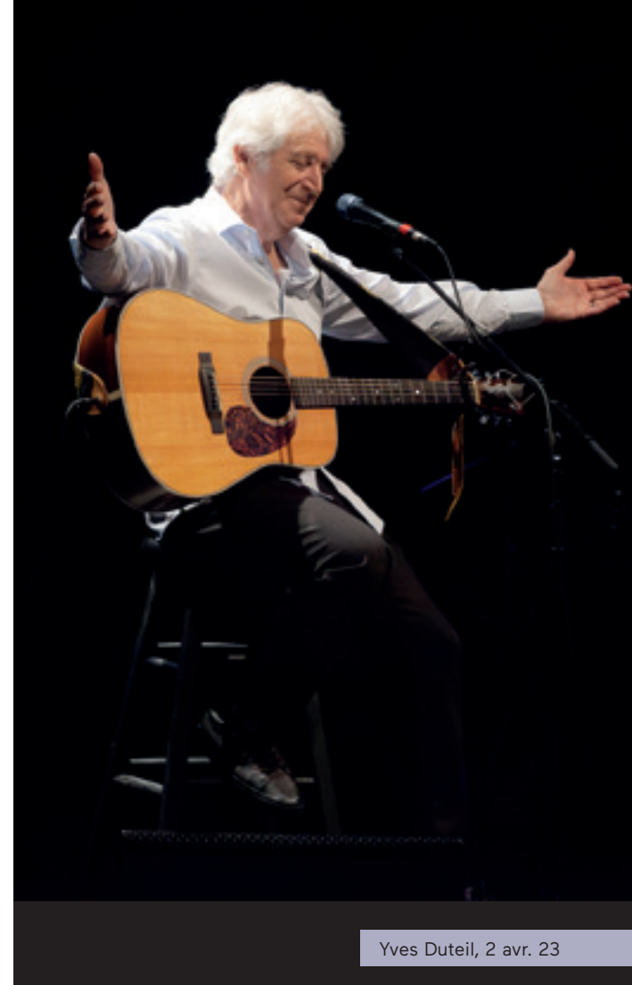
Yves Duteil, 2 avr. 23