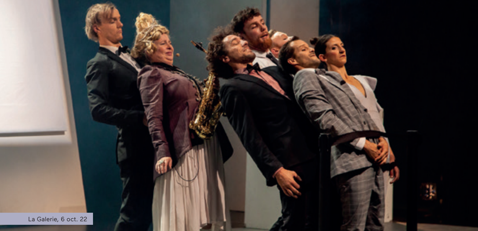
La Galerie, 6 oct. 22