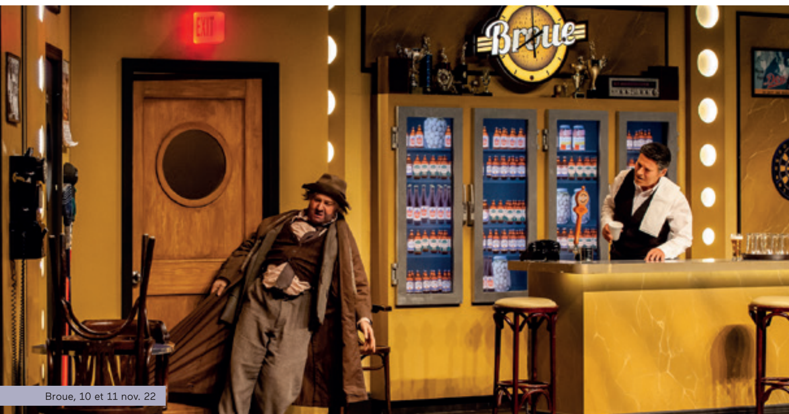
Broue, 10 et 11 nov. 22