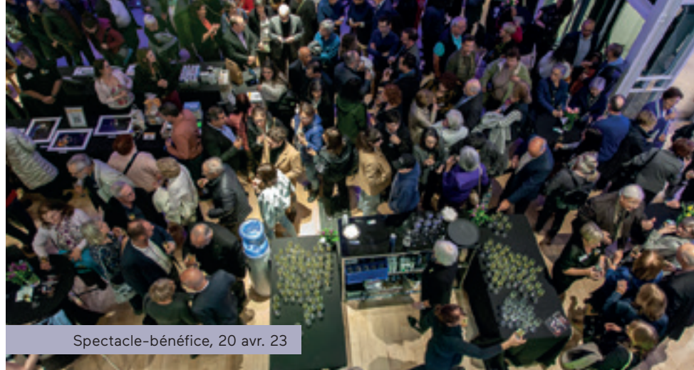
Spectacle-bénéfice, 20 avr. 23