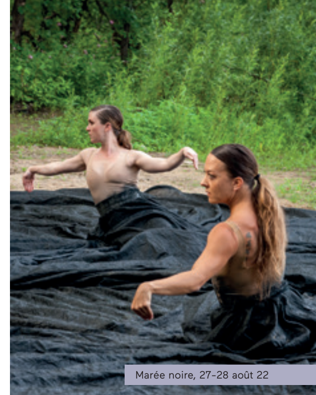
Marée noire, 27-28 août 22