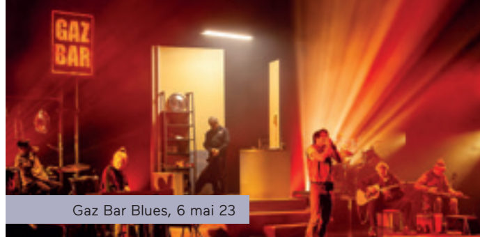
Gaz Bar Blues, 6 mai 22