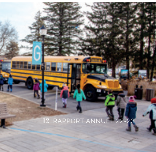
12 RAPPORT ANNUEL 22-23

Depuis les débuts de sa création, la SPJ a toujours pris le soin d'offrir au public scolaire des programmations de qualité. Cette année de tous les records en termes d'assistance en est la preuve. Voilà pourquoi nous nous assurons de rendre notre programmation accessible à tous les élèves en maintenant un coût de billets abordable, grâce, entre autres, aux sommes d'argent récoltées dans le cadre du Fonds Au cœur de la scène. La formule DUO spectacle pour les groupes du primaire et les ateliers complémentaires qui facilitent l'ouverture des élèves à une expérience culturelle complète sont offerts. Des cahiers d'accompagnements sont aussi acheminés aux enseignant.e.s. Pour une deuxième année consécutive, nous avons proposé une représentation décontractée pour les classes adaptées du CSMB. Le spectacle Chansons pour le musée a ainsi été adapté pour les besoins de ces élèves. Le spectacle Antigone sous le soleil de midi a dû être annulé en raison d'une éclosion de la COVID-19 chez une personne de la production. Pour nous aider à ajuster notre travail en ce qui concerne l'offre en milieu scolaire, un formulaire d'évaluation est envoyé aux responsables des réservations des écoles. Leurs commentaires sont recueillis et pris en compte dans la poursuite de notre engagement envers ce public.