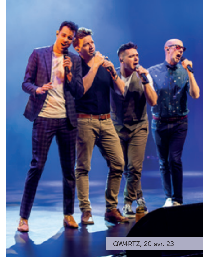
QW4RTZ, 20 avr. 23

La saison 2022-2023 a marqué un retour à la normalité après de longues années de pandémie, non seulement pour nous, mais également pour nos partenaires qui nous soutiennent financièrement. Nous tenons à remercier tous ceux qui sont restés à nos côtés et ceux qui ont rallié les rangs des partenaires solidaires de la SPJ durant la tourmente. Nous sommes particulièrement reconnaissants, puisque nous avons atteint en 2022-2023 un nouveau record sur le plan du financement issu des partenariats et des commandites.