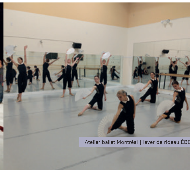
Atelier ballet Montréal | lever de rideau ÈBE