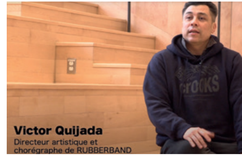
Victor Quijada Directeur artistique et chorégraphe de RUBBERBAND

Trois ateliers, et autant de rencontres après les spectacles, ont été proposés gratuitement aux familles présentes lors des représentations. La diversité de la programmation était également reflétée dans les ateliers : un atelier de création et composition avec Arthur l'Aventurier, un atelier de confection et de manipulation de marionnettes avec Puzzle théâtre et un atelier de cirque, en mouvement, par la compagnie Les Parfaits Inconnus.