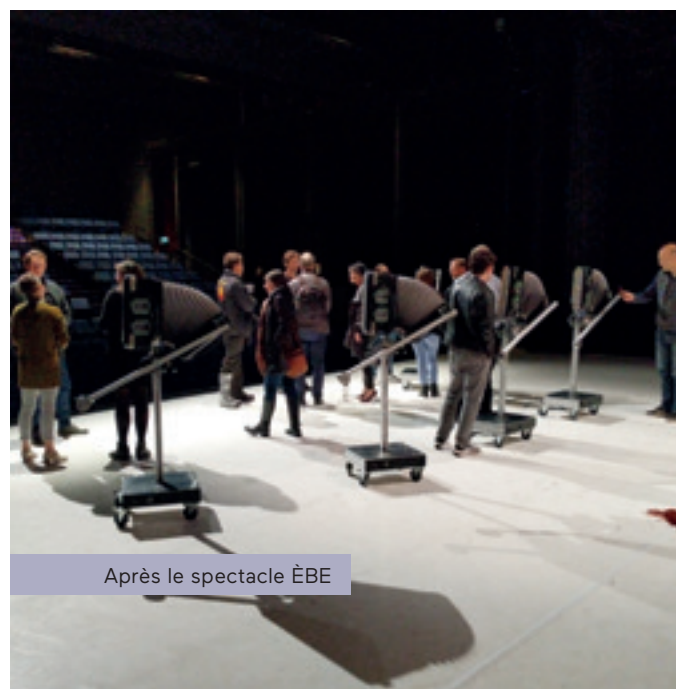
Après le spectacle ÈBE