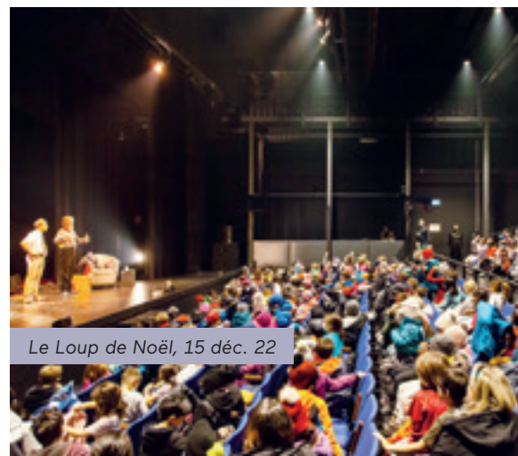
Le Loup de Noël, 15 déc. 22