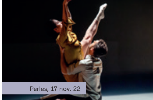
Perles, 17 nov. 22