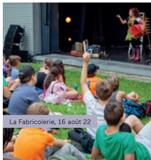
La Fabricolerie, 16 août 22