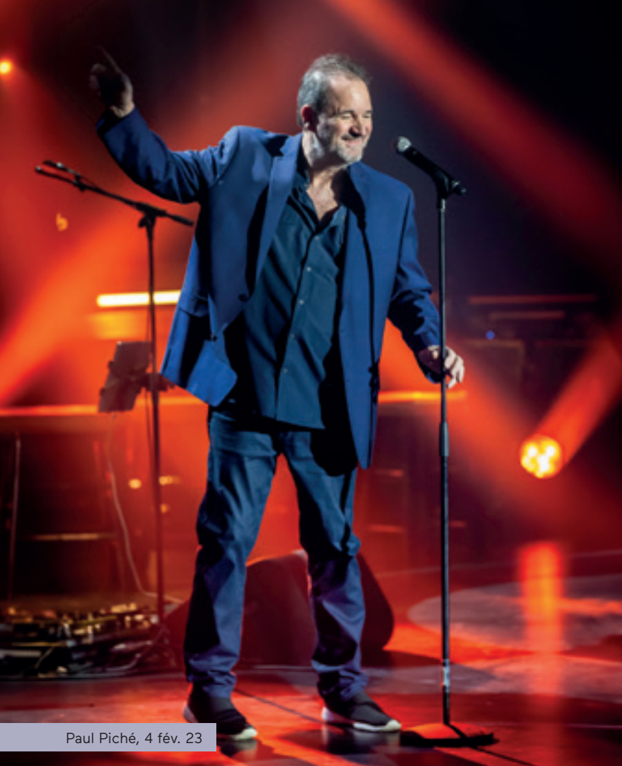
Paul Piché, 4 fév. 23