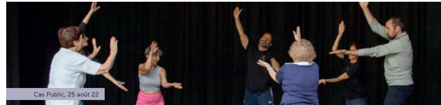
Cas Public, 25 août 22

À la Salle Pauline-Julien, les activités de médiation artistiques et culturelles en arts de la scène prennent de la place sur le tableau des accomplissements. Elles ont représenté pas moins de 286 activités avant ou après les spectacles ou d'ateliers participatifs au cours de la saison 22-23, totalisant 20 319 participations pour 80 spectacles ou artistes différents dans sept disciplines.