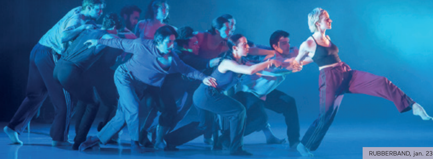
RUBBERBAND, jan. 23