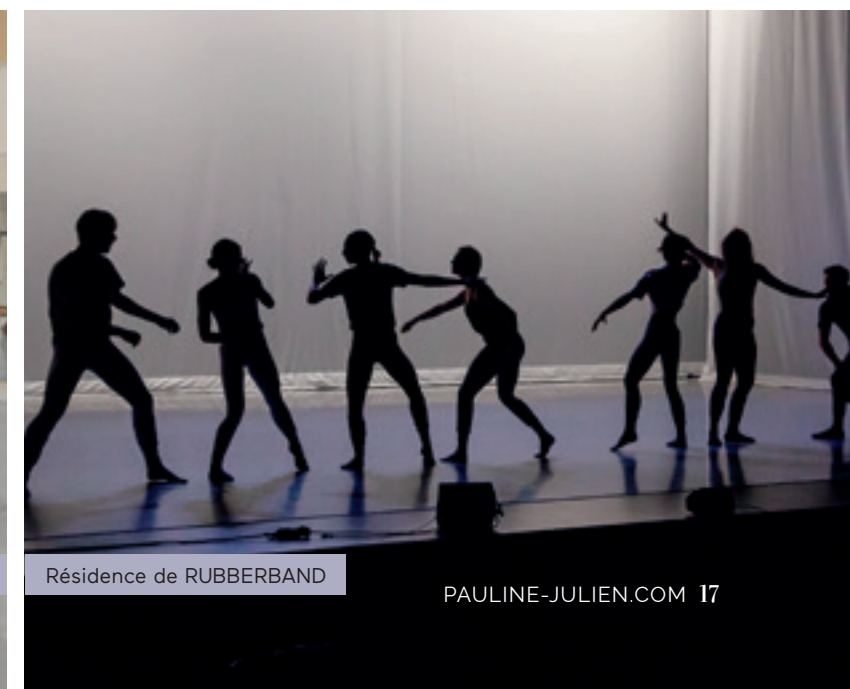
Résidence de RUBBERBAND