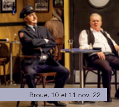
Broue, 10 et 11 nov. 22