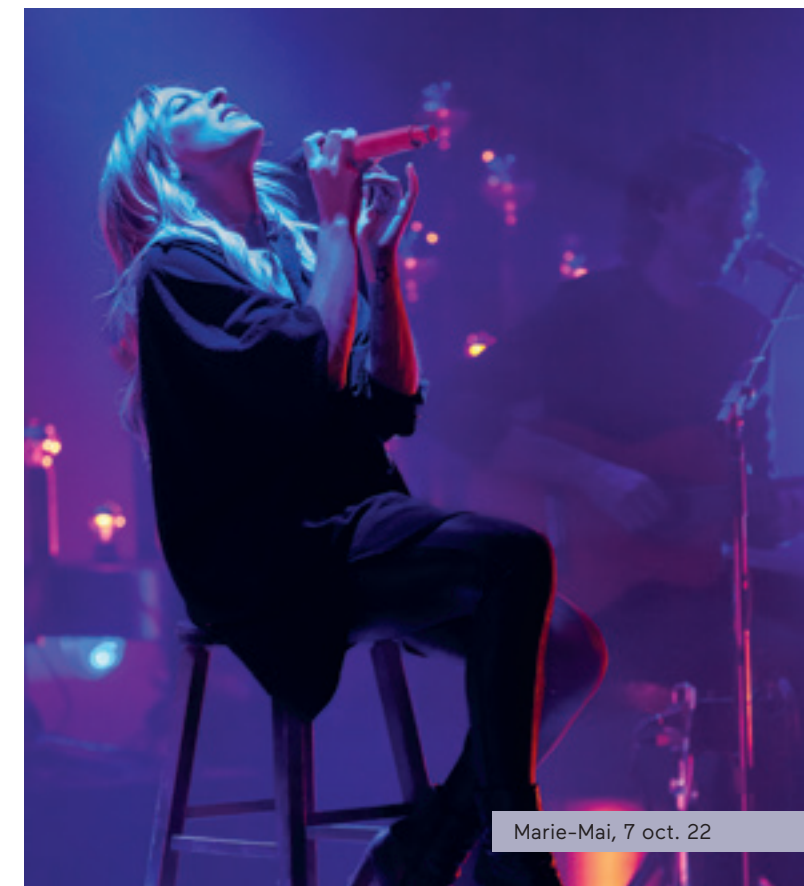
Marie-Mai, 7 oct. 22